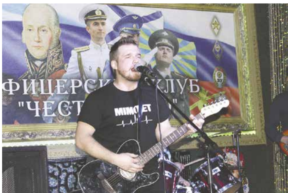
поп-рок-группа «Мимолет»