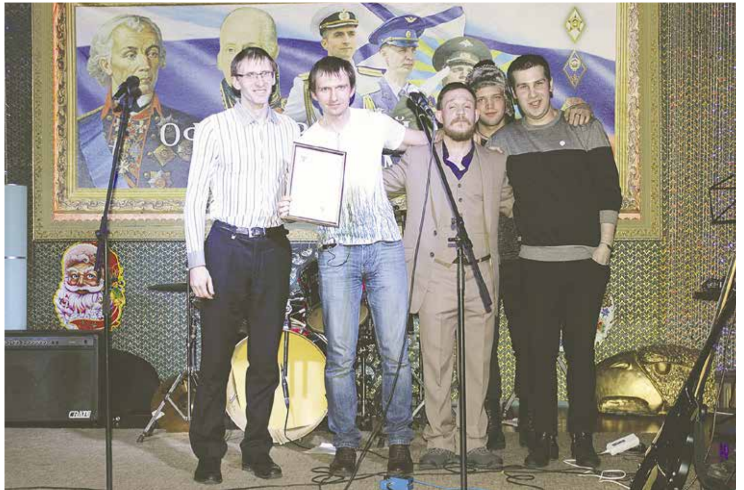
Рок-группа «Маленький принц»