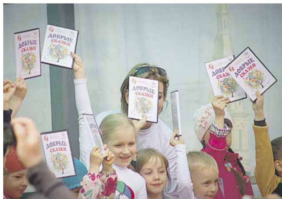
Ежегодный литературный проект «Добрые сказки»

28 мая 2017 года на летней эстраде в Верхнем парке состоялась концертная программа, посвященная Дню защи-