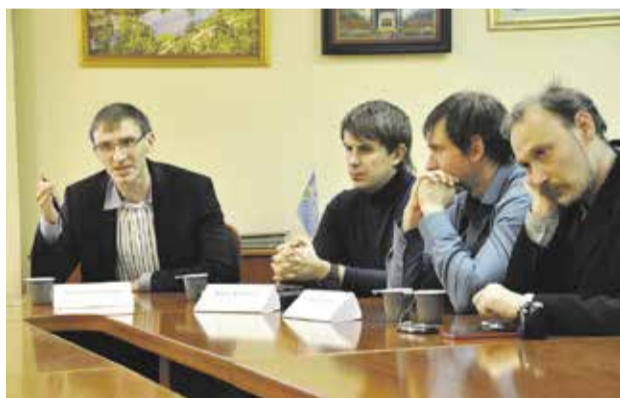
Ежегодная молодежная школа «Основы инновационного предпринимательства» в ЛЭТИ