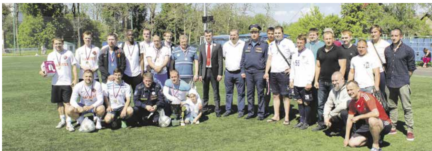
Кубок памяти друзей

17 июня 2017 года в Красном Селе прошел традиционный футбольный турнир среди команд Красного Села и Красносельского района города Санкт-Петербурга.