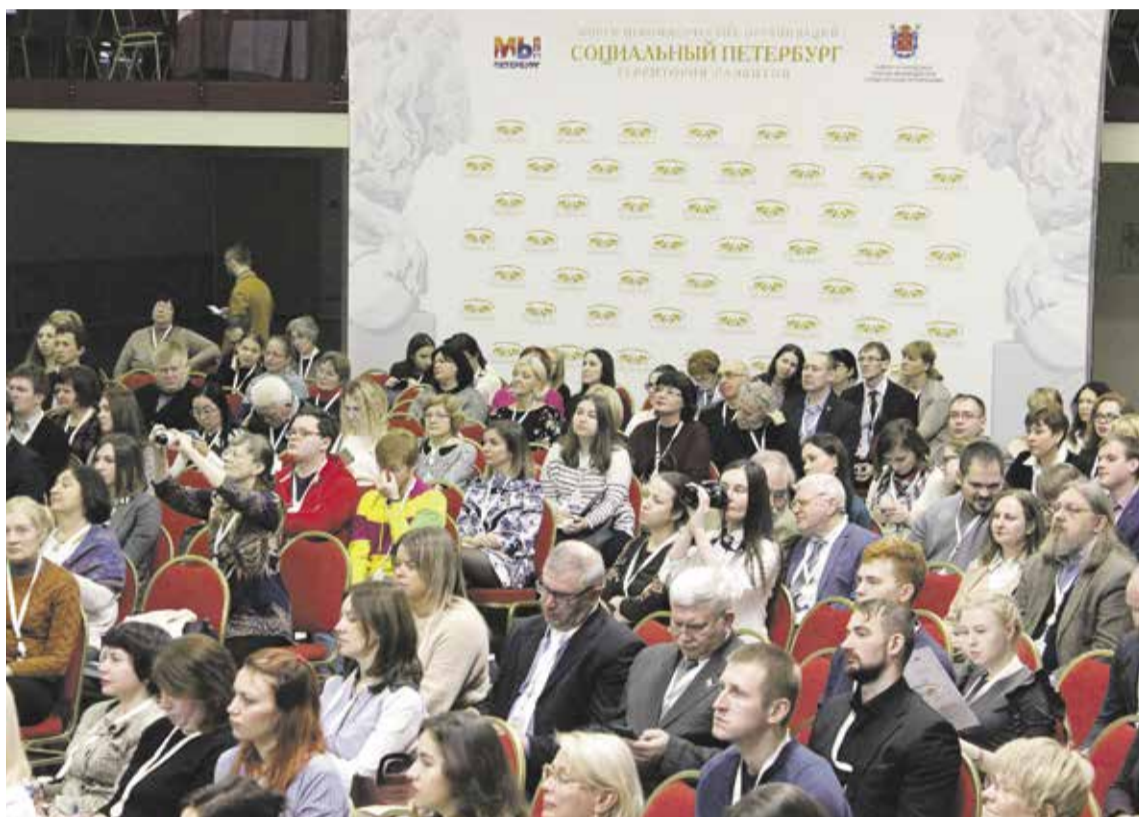
Форум некоммерческих организаций «Социальный Петербург: территория развития» ФОТО ЛИЛИИ ШАРАФУДИНОВОЙ.

Фонд принял участие во всех открытых дискуссиях, работе секций, вопросы которых являются сферой уставной деятельности организации. Вопросы государственной поддержки НКО, их роли как стратегического ресурса государственного развития находятся в поле активной деятельности Фонда. Вместе с делегатами Форума представители Фонда поддержки государственных стратегий наметили векторы социально-экономического роста региона, траектории и перспективы развития связей и сотрудничества.